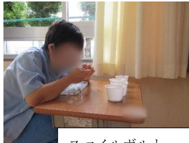
スマイルボルト (フックボルトの組立)

6月14日～25日の2週間、校内実習を行いました。2年生は4グループに分かれて、社訓や個人目標を意識して取り組みました。社会に出るために必要な力を身に付けるための学習に真剣に取り組みました。