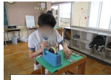
(株) 服部スクリュー (ねじの組立と梱包)