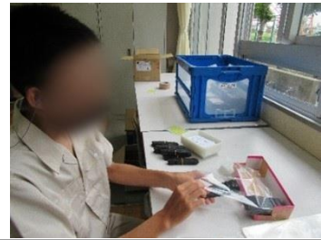
ひがどんカンパニー (プラ板を数えて束ねる・袋詰め)