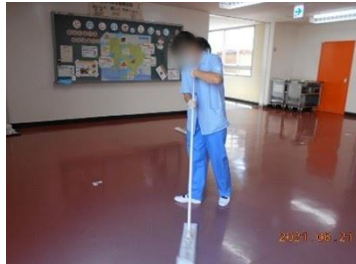
クリーン・アップ (校内清掃)